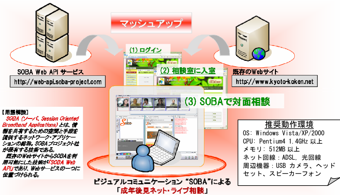
図1 SOBA Web API 技術を組み込んだ「成年後見ネット・ライブ相談」Web サイトのシステム概要